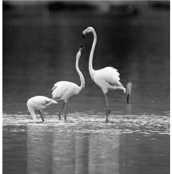
L'étang de Biguglia, ses ressources et sa vie

Chaque année, la Journée Mondiale des Zones Humides célèbre l'anniversaire de la convention de Ramsar - seul traité international dans le domaine de l'environnement - signée le 2 février 1971 dans la ville iranienne du même nom. L'objectif de la manifestation : faire connaître au plus grand nombre ces espaces naturels si particuliers que sont les zones humides, tout en sensibilisant le public aux enjeux environnementaux mais aussi économiques et sociaux qui y sont étroitement liés. Première zone humide de Corse , la réserve naturelle de l' étang de Biguglia bénéficie du label « Ramsar » depuis le 8 avril 1991. Sur l'île, deux autres sites Ramsar sont également gérés par le Département de la Haute-Corse . Il s'agit des étangs d'Urbinu et de Palu , dont le Conservatoire du littoral est propriétaire, et qui ont obtenu ce label de reconnaissance internationale le 15 septembre 2008.