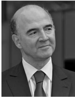
Pierre Moscovici, Ministre de l'Economie et des Finances