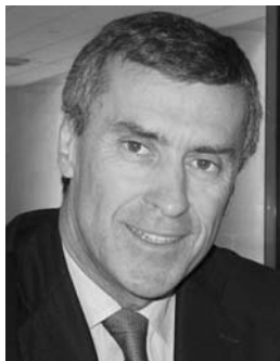
Jérôme Cahuzac, Ministre délégué au Budget